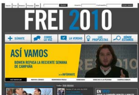
Frei resalta por la "modernidad" de su web.