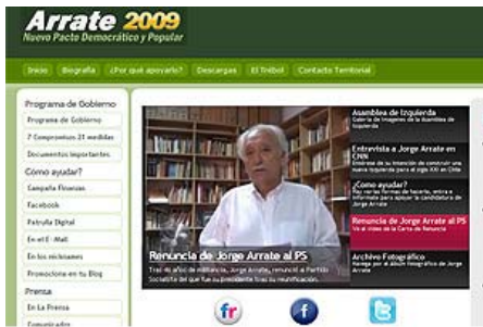
Arrate destaca por el diseño de su página.