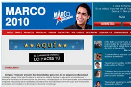
Enríquez-Ominami destaca por "el adecuado empleo de Twitter y Facebook".